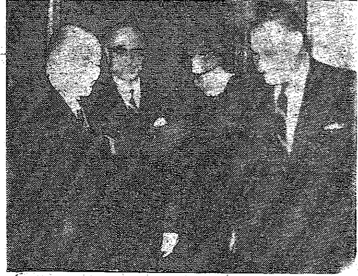
سيادة الرئيس جمال عبد الناصر يستقبل دولة السيد بهجت التلهوني رئيس الوزراء الأردنية ليلة أمس الأول